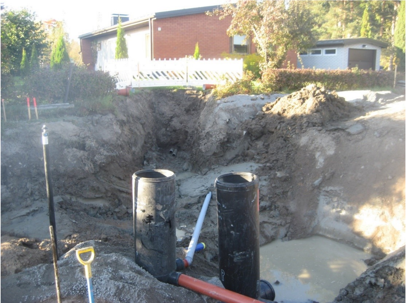
Talohaarojen saneeraus.

Tässä valokuvassa näkyy työmaa talohaaran rakentamisen näkökulmasta. Jokaisella kadulla on oma tilanne, ja kuvan tarkoitus on vain selkeyttää, miltä työmaa suurin piirtein näyttää.