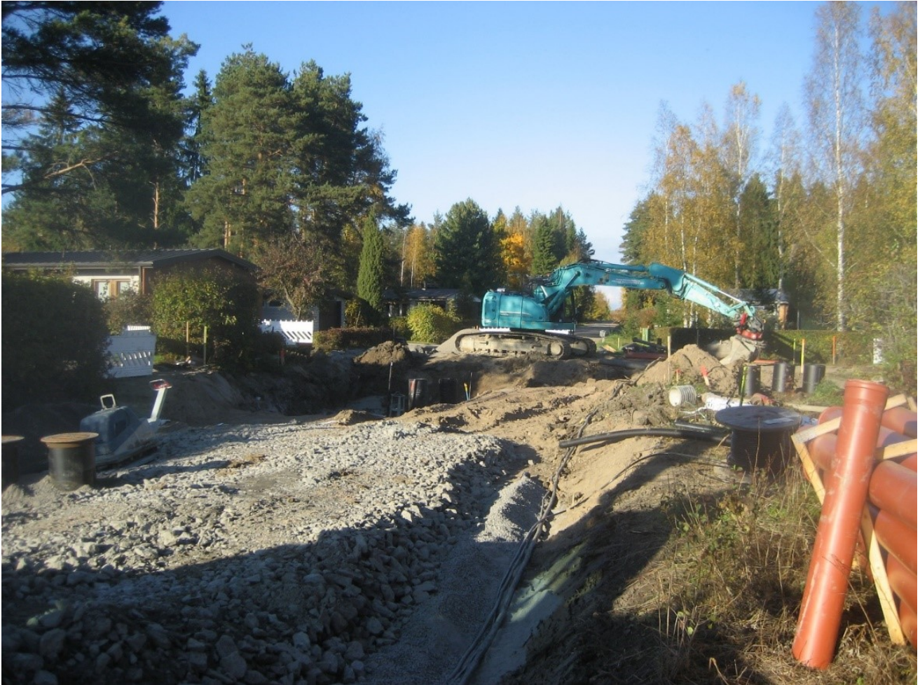
Kadun- ja vesihuollon saneeraustyömaa.

Tässä valokuvassa näkyy katualueen työmaa. Jokaisella kadulla on oma tilanne, ja kuvan tarkoitus on vain selkeyttää, miltä työmaa suurin piirtein näyttää.